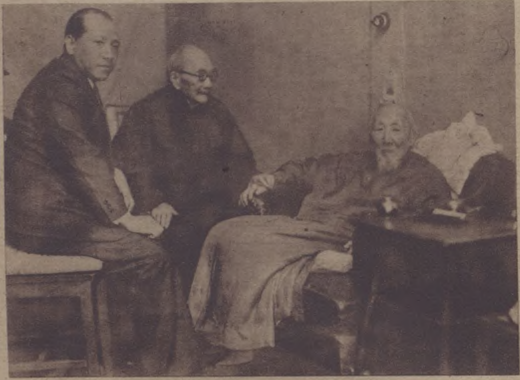
矣作均二。深把老馬滬儀唐 。古已老今談臂，相訪至紹

本壤山頽慟國師暮年 如園為岷岷造詩佳惜 龜堂老飲至以京金旨期 相老人遺像 若谷之題 二十八年十二月廿五日 吳仁利 拜