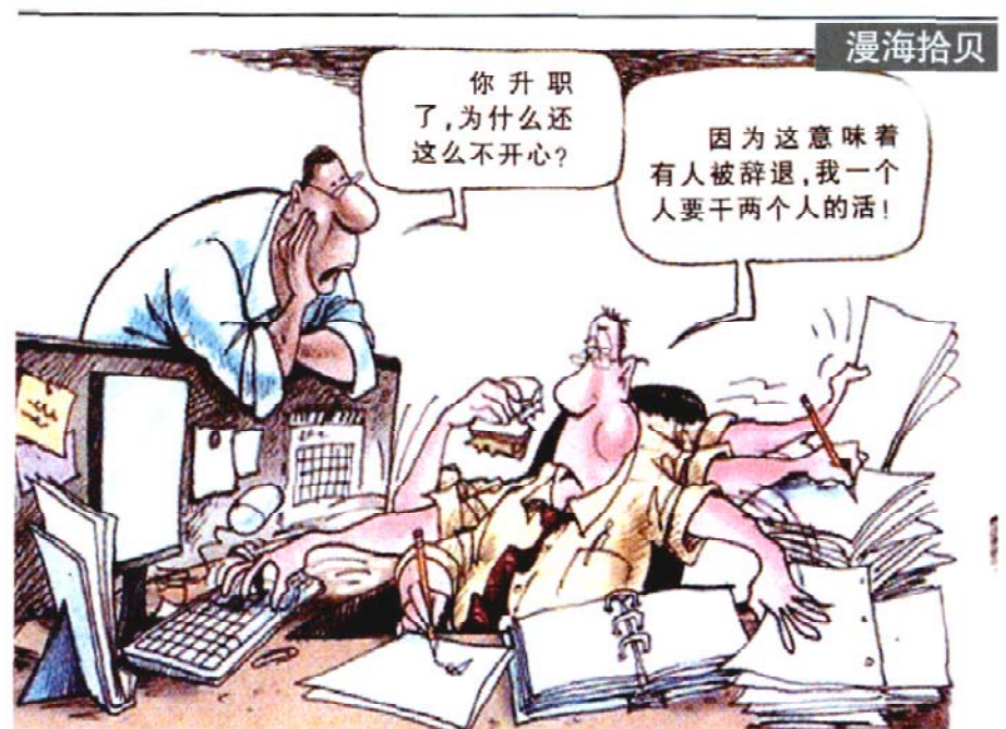
现在升职并不是什么好消息