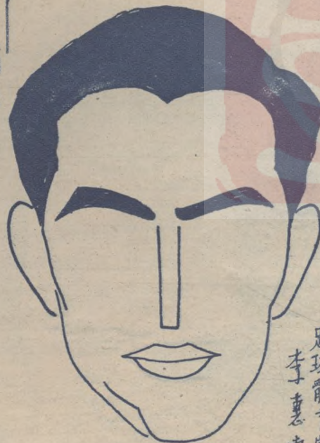
李惠堂 足球體育家