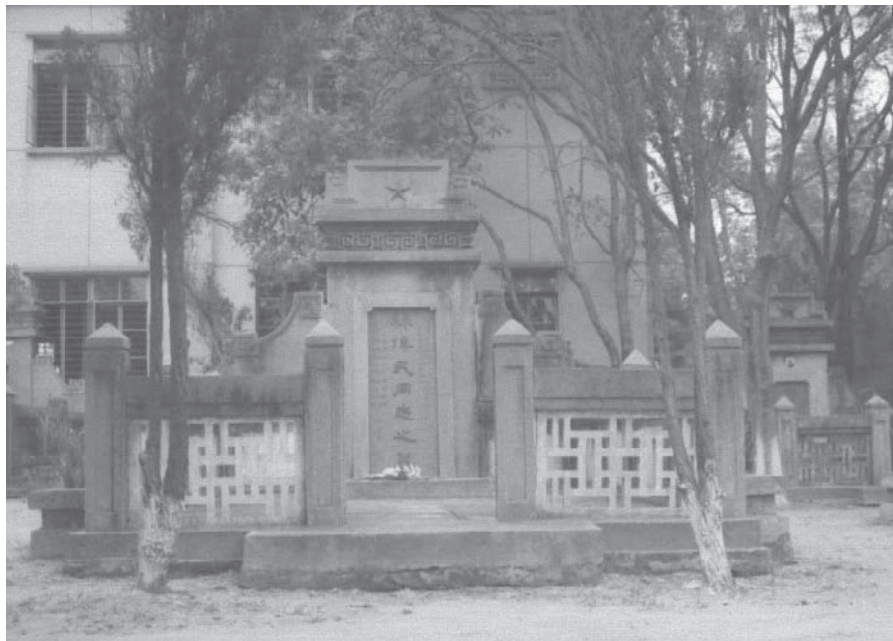
新中国成立后，在广东省省长陈郁关注下，于广州银河公墓建造了林伟民同志墓，以供世人凭吊。

期间，林伟民曾到纺织工厂参观访问。他发现很多女工上班时带了孩子到工厂来。原来工厂设有托儿所。孩子们由托儿所负责照料，女工们可以安心劳动，下班时再带回家里。林伟民看见孩子们身体健壮，活泼可爱，心里非常羡慕；同时又为祖国家乡孩子们的悲惨命运感到万分难过。在帝国主义和封建主义的残酷压迫统治下，中国人民陷于水深火热的深渊之中。很多贫苦人家的孩子出生后，无法养活，往往含泪将他们遗弃或卖走。目睹此情此景，林伟民思潮汹涌，内心激励着自己日后要为解除祖国同胞的深重苦难而加倍努力奋斗。