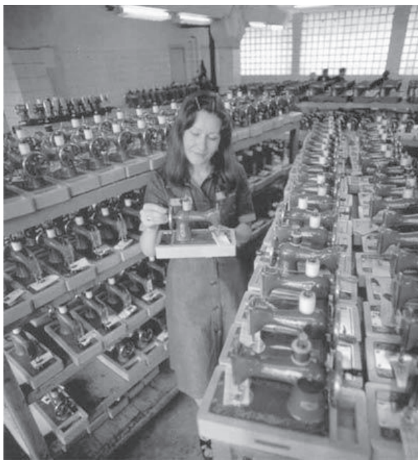
苏联缝纫机厂的女工

办的《青年周刊》等刊物，也经常对罢工斗争进行情况以至斗争方向等问题，及时发表文章或消息，表示真诚的支持和帮助。罢工胜利结束时，《广东群报》又及时发表了一些文章，帮助香港海员总结这次罢工斗争的经验教训，激励他们继续前进。中共广东支部书记谭平山于《广东群报》发表题为《欢送海员》的“评论”中指出：“罢工海员在罢工当中，所获种种的教训和种种的训练，自然增加了许多知识和许多经验，故今后定有更强固更