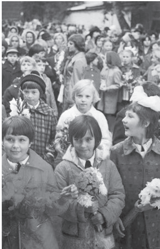
手持鲜花的苏联儿童

俄国现在各处的民众，其食料及衣服虽稍形缺乏，然为拥护劳农政府而毫无怨言。不但无怨言，而且对于劳农政府的主义及政策，非