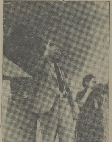
合表，空軍優良，堪稱與德國 川陳開，旗鼓相當，纔可以支持 縣雲感，得住。至於蘇俄在東方 民雲感，得住。至於蘇俄在東方 舉將奮，邊境，也正在顧慮日本 眾軍。的進攻，但是日本十分 行向。小心，亦正在顧慮，不 機眾。敢輕舉妄動。日本顧慮 禮致。什麼呢，最明顯的還是 時詞。因為蘇俄空軍比日本佔 蔣，情。着絕對優勢。以前張鼓 委詞。峯諾門罕兩次日蘇衝突 長懇詞。代筆

，日本吃虧不少，所以趕快結束，得了很大的教訓，以後更不得不特別謹慎。現在如果一旦開釁，蘇聯的機羣，由海參威飛往日本轟炸，日本感受重大威脅，民氣更要低降了。照以上所舉各種例證看來，可知今日空軍在戰爭中所佔的重要性爲如何了。又照以上的例證看來，我們得到兩種感想：第一，我國空軍在此短短的歷史過程中，以較低的力量與敵人周旋，得到許多偉大的成就，是值得我們紀念的。第二，我們看得列強爭取空軍優勢的激烈，反觀自己，焉可不憬然覺悟，急起直追，速建空軍，以驅頑敵。有此兩種感想，所以必須舉行這空軍紀念節，來喚醒國人羣起努力了。