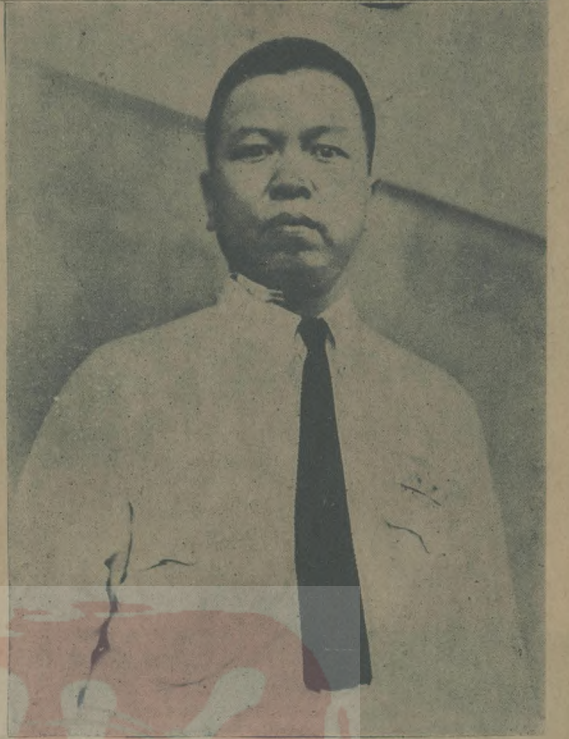
→ 領導空軍作戰之航空學校校長陳慶雲氏