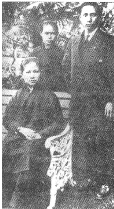
孙中山的三个儿女合影（右为孙科，左为长女孙缦，后为次女孙婉）。