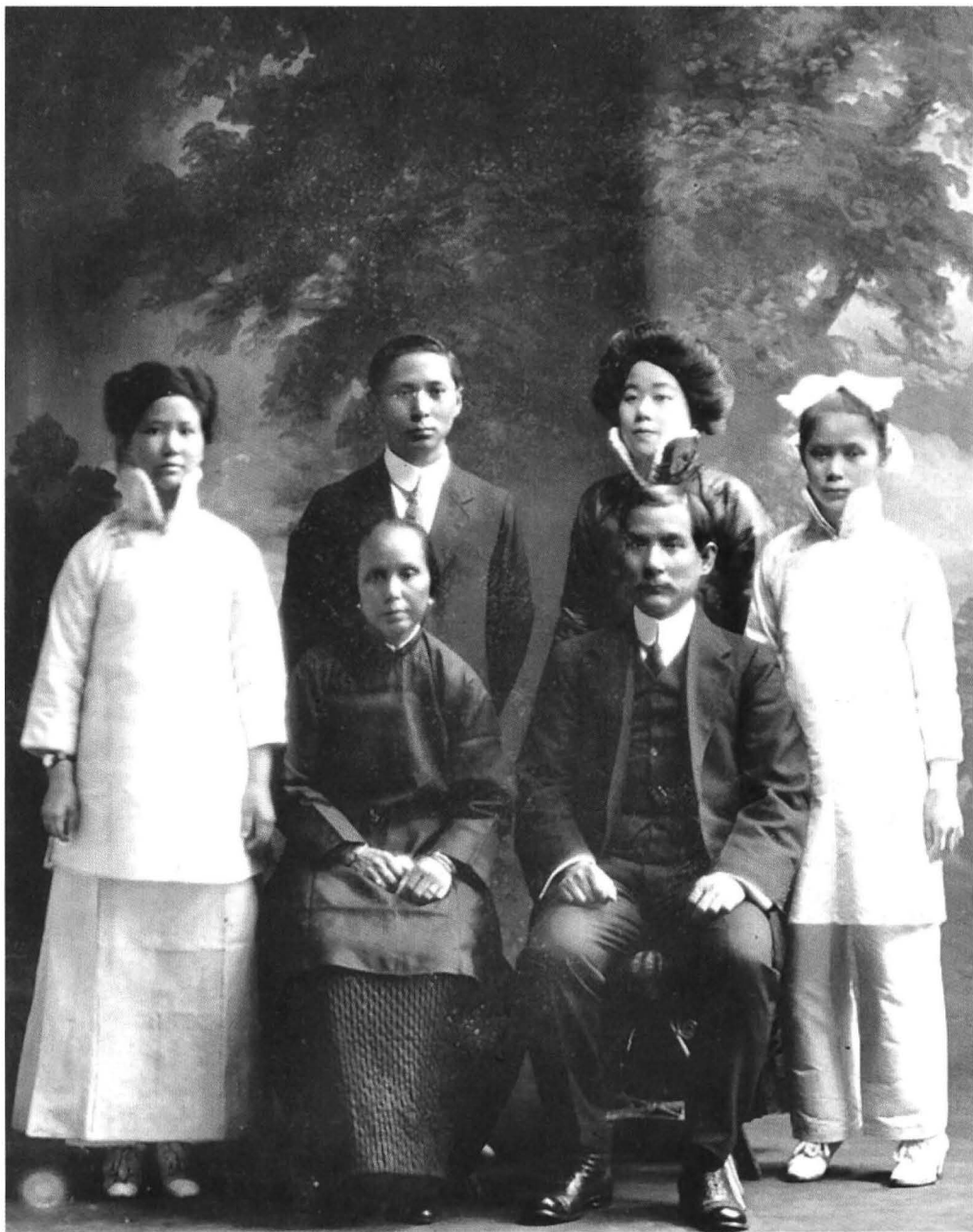
● 圖為孫中山先生與盧夫人及其子女合影

美國領事出面營救未果，陸皓東、丘四、朱貴全等四十餘位被捕的志士受盡酷刑後全遭殺害。酷刑煎熬