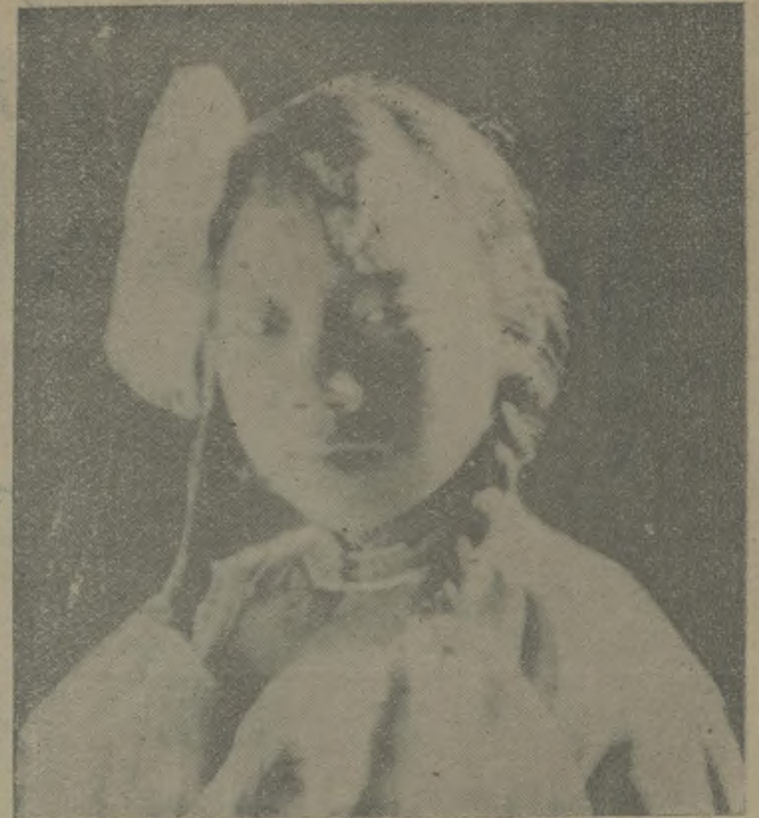
髮絲擊以細翠色以雪青與粉紅者為多迎風飛舞益增兒童之活潑 (丁惠康君攝)