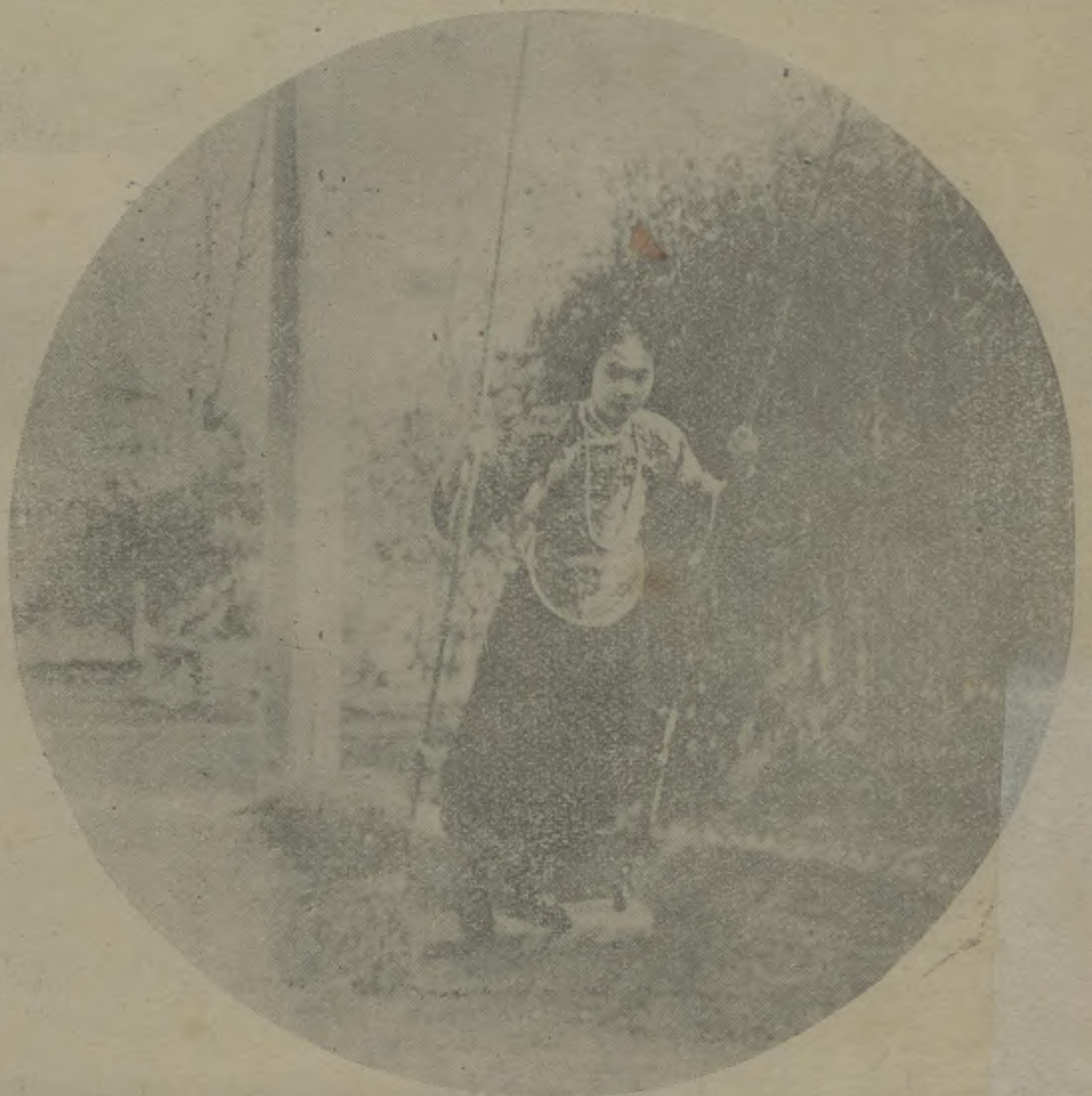
「琴弦變音記」之一幕