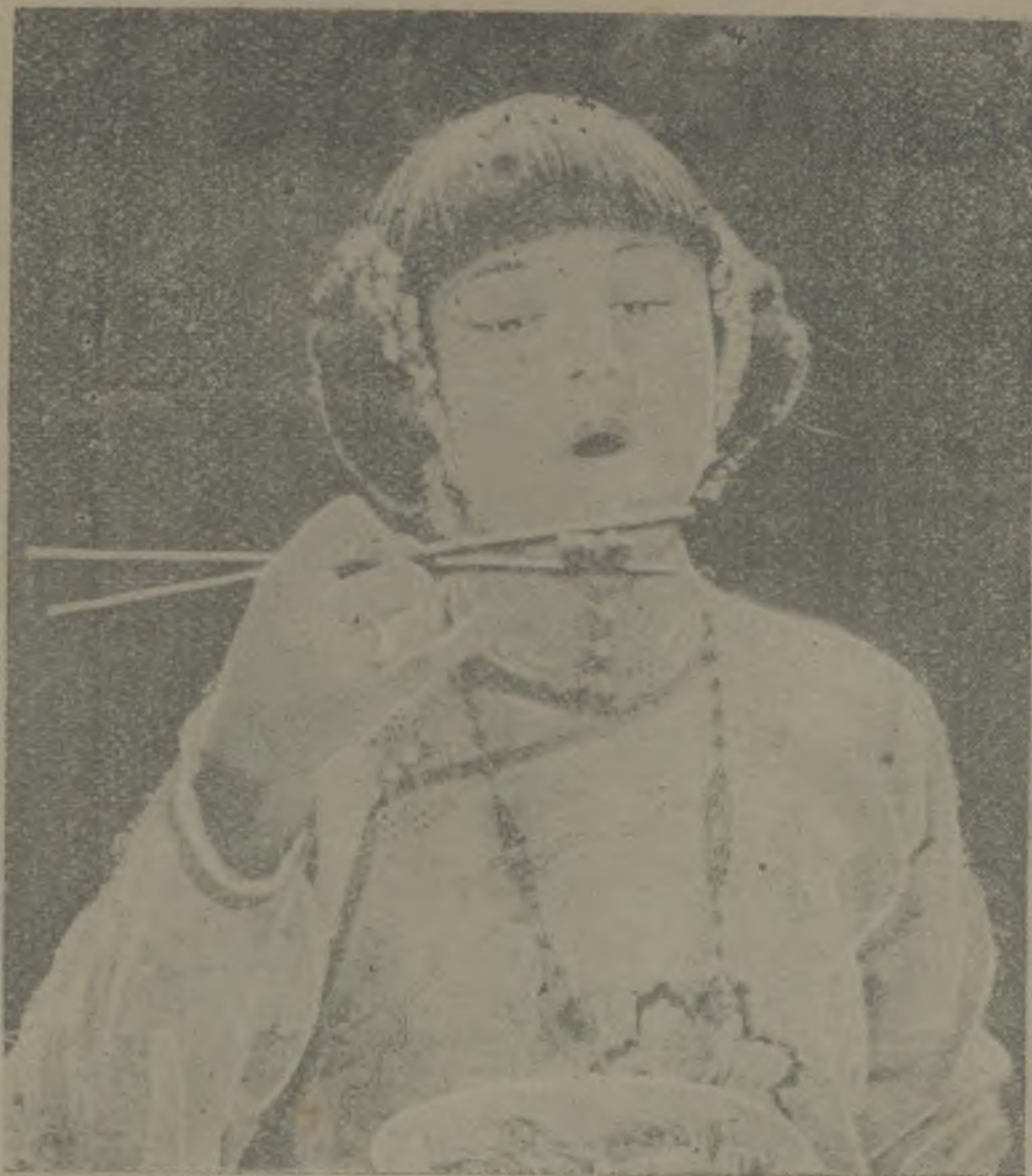
美國戴婉兒 Dorothy Devore 女士喬裝華人用中國器皿吃中國菜之美姿聞此風隨麻雀牌而流行日增月勝云